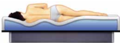
El matalàs d'aigua s'ajusta perfectament al cos

A més dels beneficis directes que aporta la relaxació, el llit ajuda a alleugerir les pressions i conciliar una son tranquil·la i profunda, ja que la persona no es belluga amb tanta freqüència durant la nit.