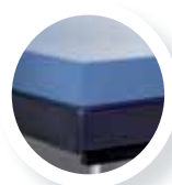
Matalàs d'aigua + base