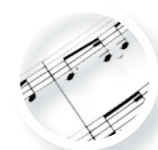
Matalàs d'aigua + base vibromusical